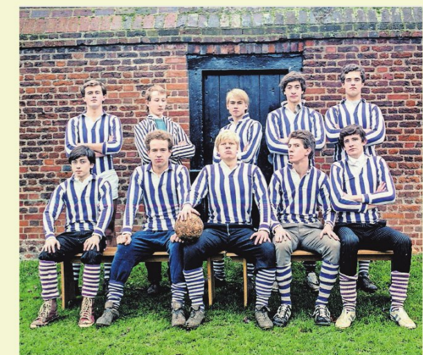
▲ Voor Eton College zijn diepe zakken nodig. Midden voor: oud-premier Boris Johnson.

De A-levels zijn van levensbelang. Om bij een topopleiding binnen te komen zijn alleen tieners voldoende. Niet toevallig scoren kinderen uit buurten met goede ‘primary-’ en ‘secondary schools’ het best. De Cito-toets mag mijn vriend vreemd overkomen, in het VK bepalen je postcode en je bankrekening vanaf de kleuterschool grotendeels je lot.